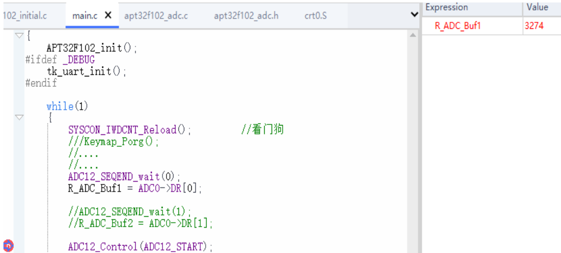
图 3.4.1 采样值